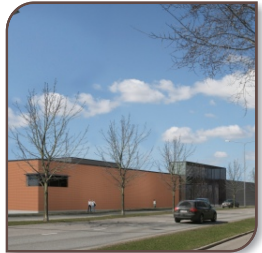
Blick aus Satakunnantie

Auf das Wohlergehen der Kunden und Arbeitnehmer wird insbesondere Rücksicht genommen, indem die Räume hell und sowohl im winterlichen Frost als auch in der Sommerhitze gleichmäßig warm gestaltet werden. Eine der wichtigsten Eigenschaften im Neubauprojekt ist die Möglichkeit, auf das Endergebnis einwirken zu können. Die fortgeschrittenen Pläne des Projektes können an die Bedürfnisse des Kunden angepasst werden. Die Lage des Objektes verbessert sich jeden Tag mit der starken Entwicklung der Projekte in der Umgebung.